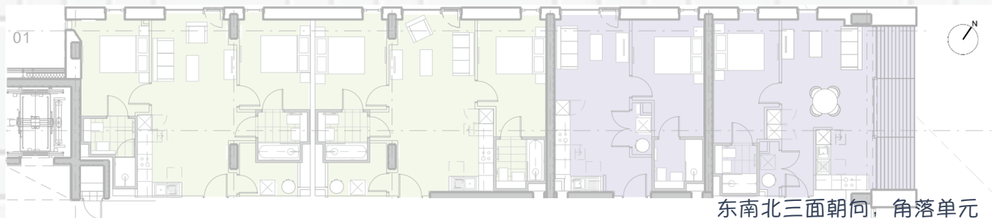
东南北三面朝向，角落单元